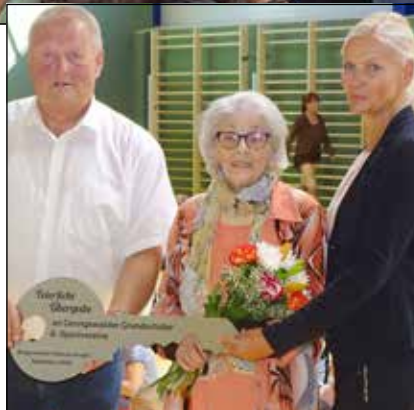
Die feierliche Schlüsselübergabe der neuen Turnhalle an die Vereine erfolgte am 23.9.2020 (oben) – sogar der MDR berichtete aus unserer Stadt. Bereits am 11.9.2020 erfolgte die Übergabe an die DWS.