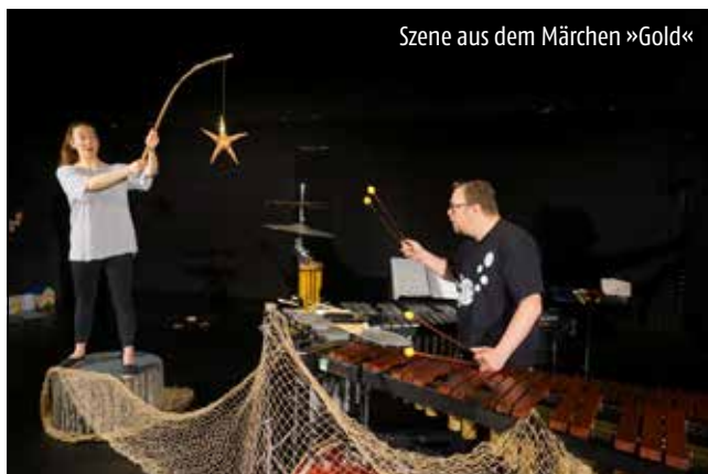
Szene aus dem Märchen »Gold!«