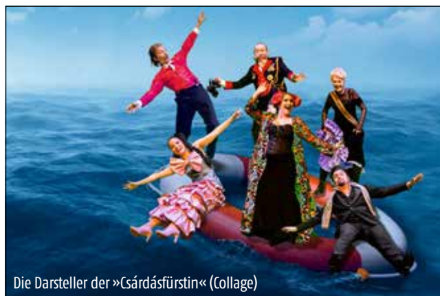
Die Darsteller der »Csárdásfürstin« (Collage)