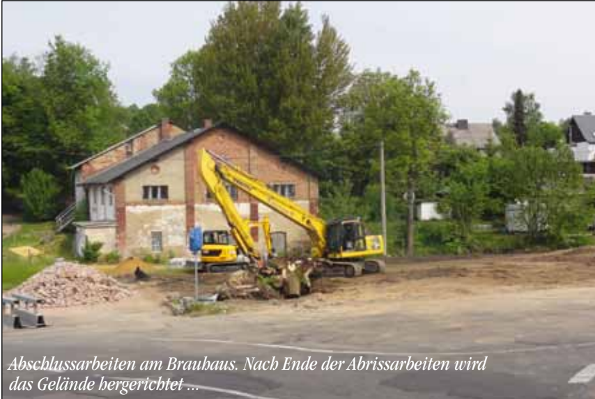
Abschlussarbeiten am Braubaus. Nach Ende der Abrissarbeiten wird das Gelände bergerecht ...