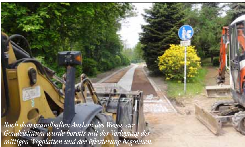
Nach dem grundhaften Ausbau des Weges zur Gondelstation wurde bereits mit der Verlegung der mittigen Wegplatten und der Pflasterung begonnen.