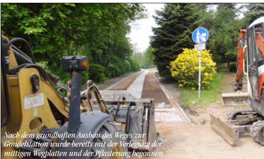
Nach dem grundhaften Ausbau des Weges zur Gondelstation wurde bereits mit der Verlegung der mittigen Wegplatten und der Pflasterung begonnen.

Die Stadt hat bereits frühzeitig, d.h. seit Klarheit über den bevorstehenden Rückbau des Brauhauses bestand, dem Landkreis signalisiert, dass dieser Ausbau für die Stadt Geringswalde sowohl verkehrstechnisch als auch städtebaulich von höchster Priorität ist.