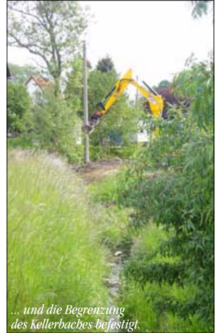
... und die Begrenzung des Kellerbaches befestigt.