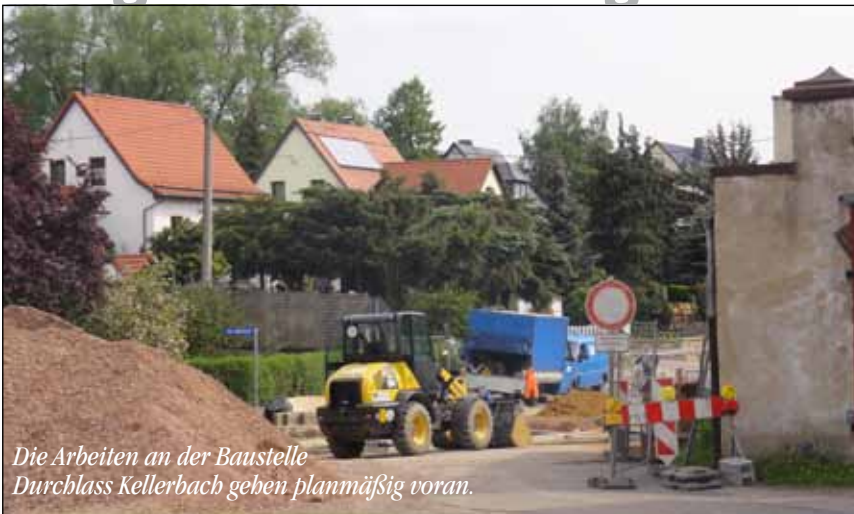
Die Arbeiten an der Baustelle Durchlass Kellerbach geben planmäßig voran.