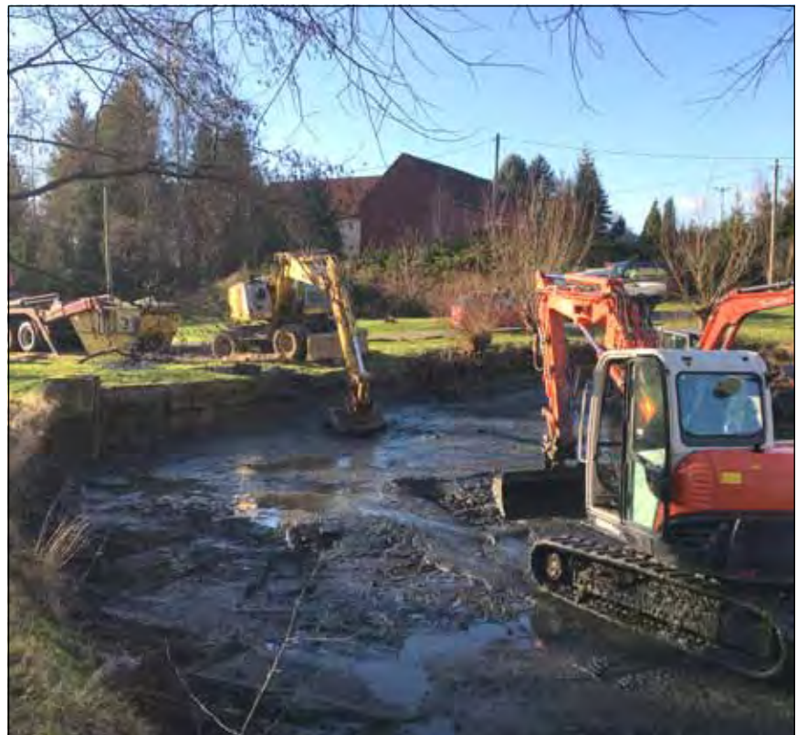
In Arras wurde der Feuerlöschteich geschlänmt und in Stand gesetzt.

Sächsische Tierseuchenkasse Anstalt des öffentlichen Rechts Löwenstr. 7a, 01099 Dresden Tel: 0351 / 80608-0, Fax: 0351 / 80608-35 E-Mail: info@tsk-sachsen.de Internet: www.tsk-sachsen.de