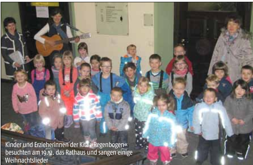
Kinder und Erzieherinnen der Kita »Regenbogen« besuchten am 19.12. das Rathaus und sangen einige Weihnachtslieder