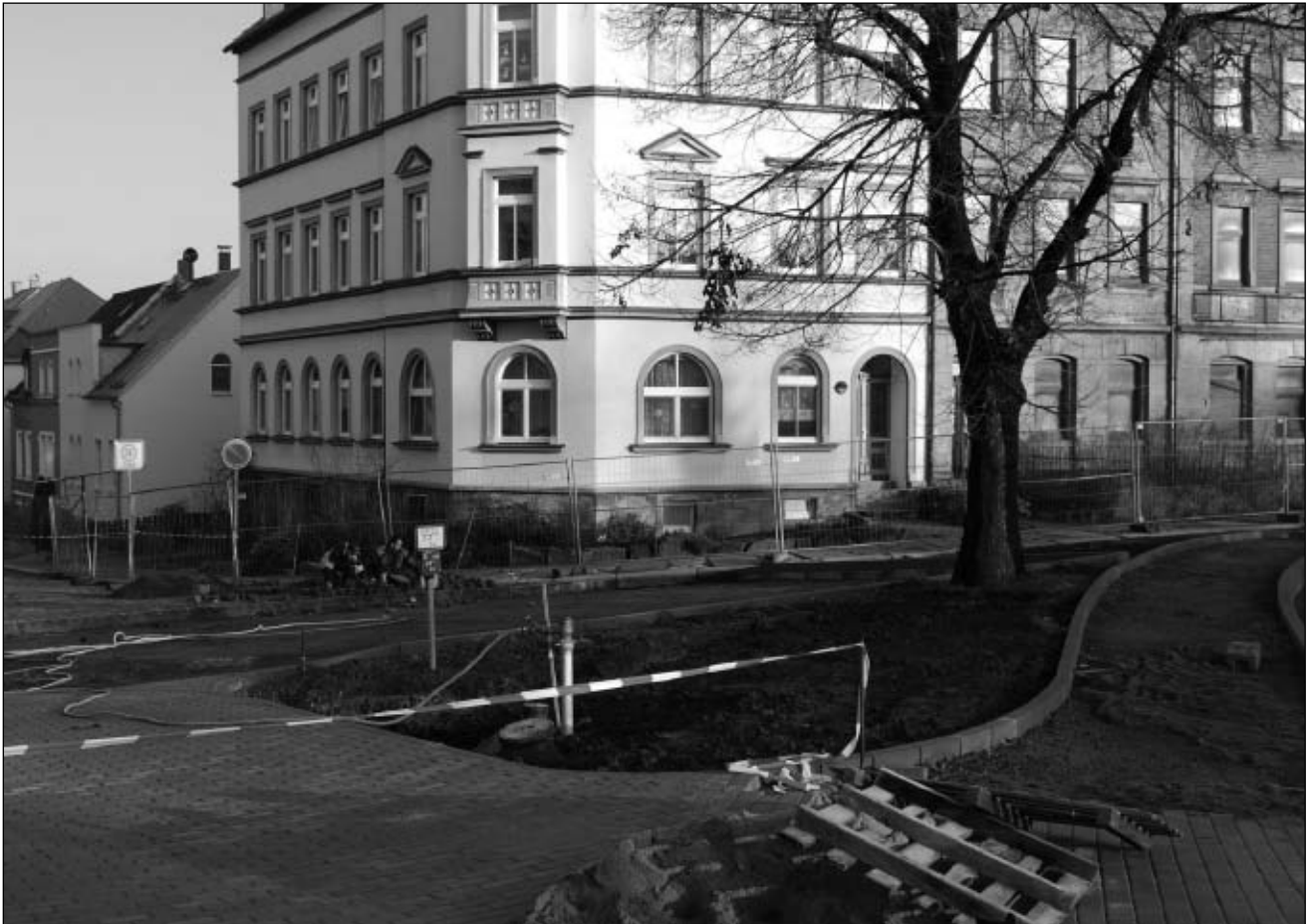
Die Sanierung der Arasser Straße in die Einmündung Bahnhofstraße wurde neu konzipiert.