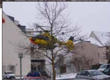
Außergewöhnlicher Besuch in Geringswalde: Am Vormittag des 23. Januar 2013 musste im Rahmen eines Rettungseinsatzes dieser ADAC-Rettungshubschrauber auf dem Parkplatz der Sparkasse landen.

welche zum Tatzeitpunkt unter Strom standen. 25 m Kabel wurden entwendet.