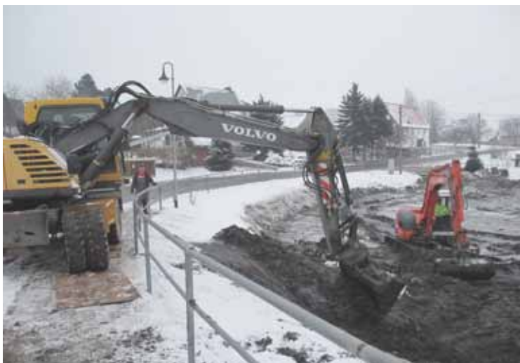
Die Teichentschlammung in Hoyersdorf geht voran.