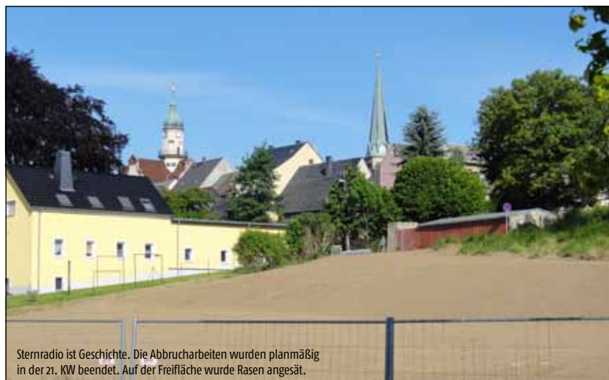
Sternradio ist Geschichte. Die Abbrucharbeiten wurden planmäßig in der 21. KW beendet. Auf der Freifläche wurde Rasen angesät.

Redaktionsschluss für die Juli-Ausgabe: 13. Juni 2014 Druck: Druckerei Biewald, Geringswalde Herstellung/Vertrieb: Geringswalder Verlag + Werbeagentur Dresdener Straße 184 · 09326 Geringswalde Telefon: (03 73 82) 1 22 73 · Telefax: (03 73 82) 1 22 76 E-Mail: sebheinecker@gmx.de Verantwortlich für das Amtsblatt der Stadtverwaltung Geringswalde: Der Bürgermeister