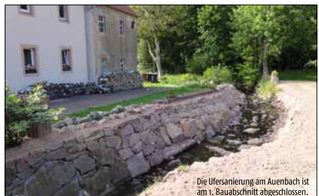
Die Ufersanierung am Auenbach ist am 1. Bauabschnitt abgeschlossen.