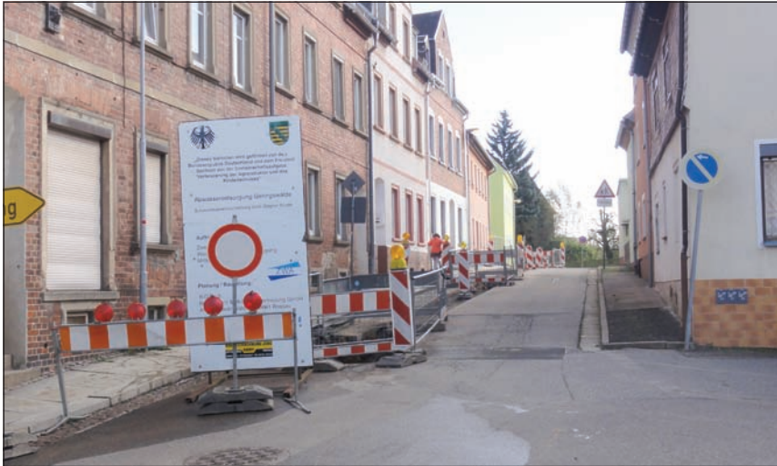
Die Bauarbeiten der ZWA zur Schmutzwassererschließung auf der unteren Erich- Zeigner-Straße gehen planmäßig voran.